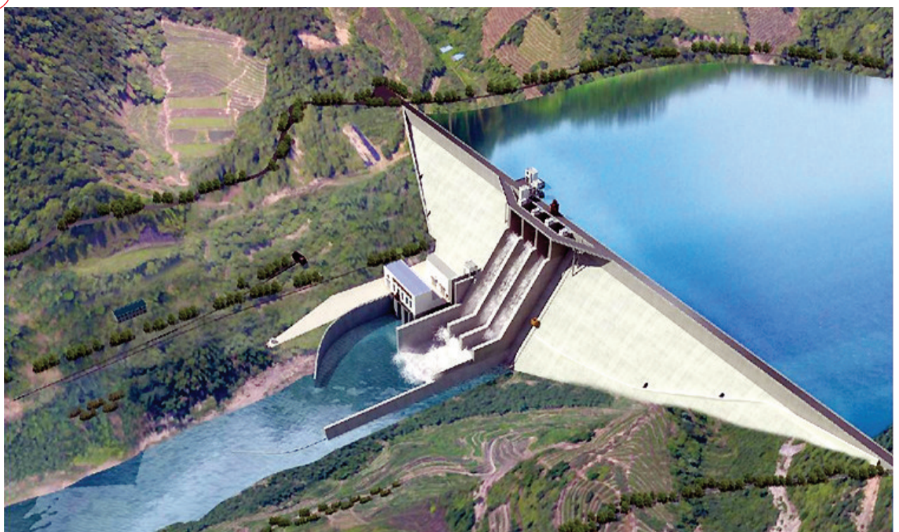
福州重大水利民生項目——“一庫兩綫”工程提上議事日程,開啓前期規劃論證。

據福州市水利部門介紹,“一庫兩綫”工程,將開發利用大樟溪優質水源,建設大型龍湖水庫和兩條輸水綫路,將向福州主城區和濱海新城、東南科學城(含大學城)提供充足的優質水,受益人口近400萬。